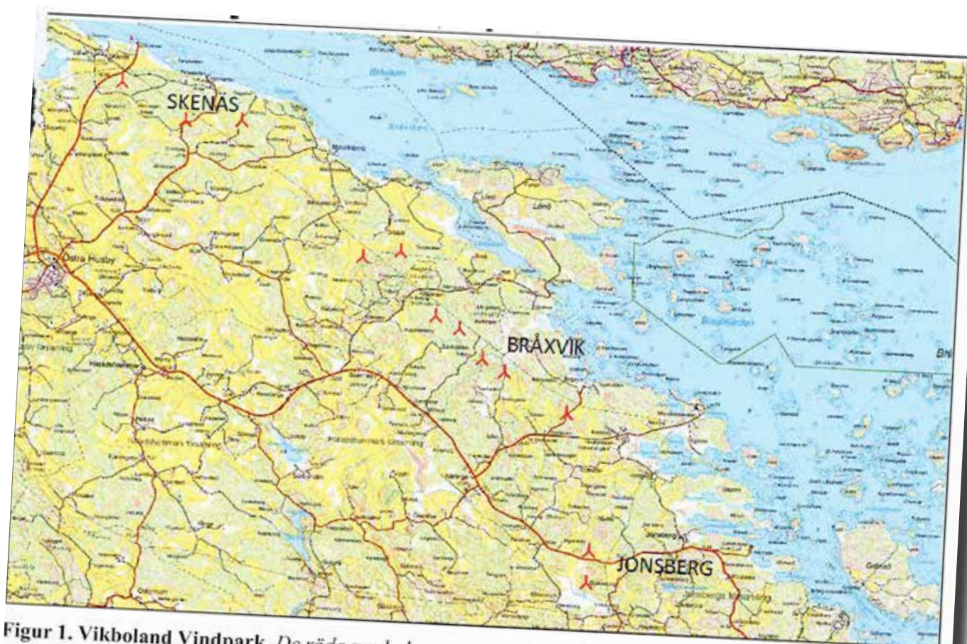
Figur 1. Vikboland Vindpark. De röda symbolerna representerar vindkraftverk, som finns i tre områden Skenäs, Bråxvik och Jonsberg.